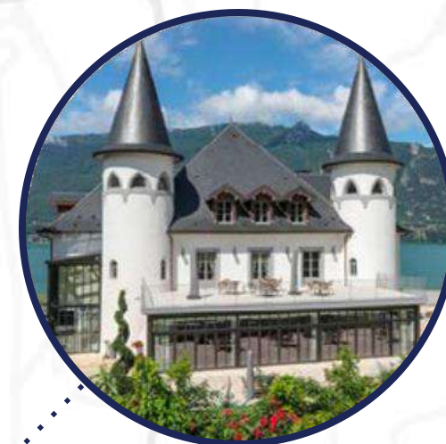
Château de Tresserve