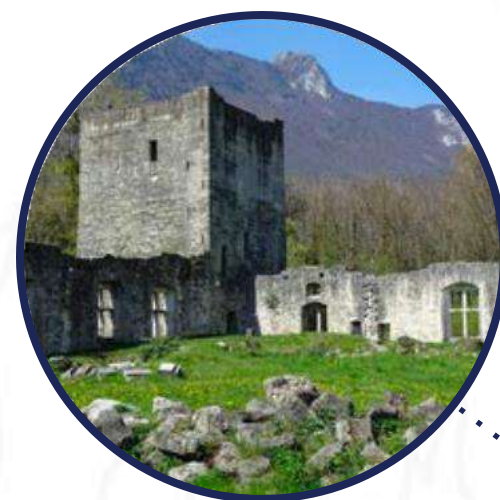
Château de Thomas II