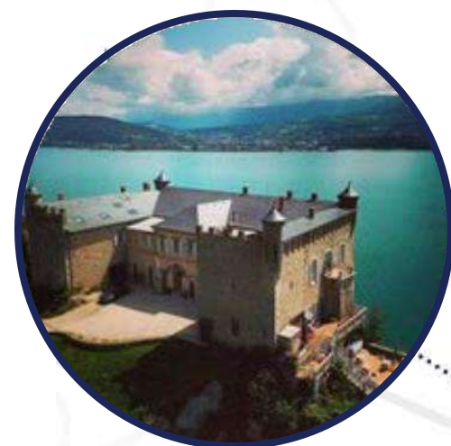
Château de Bourdeau